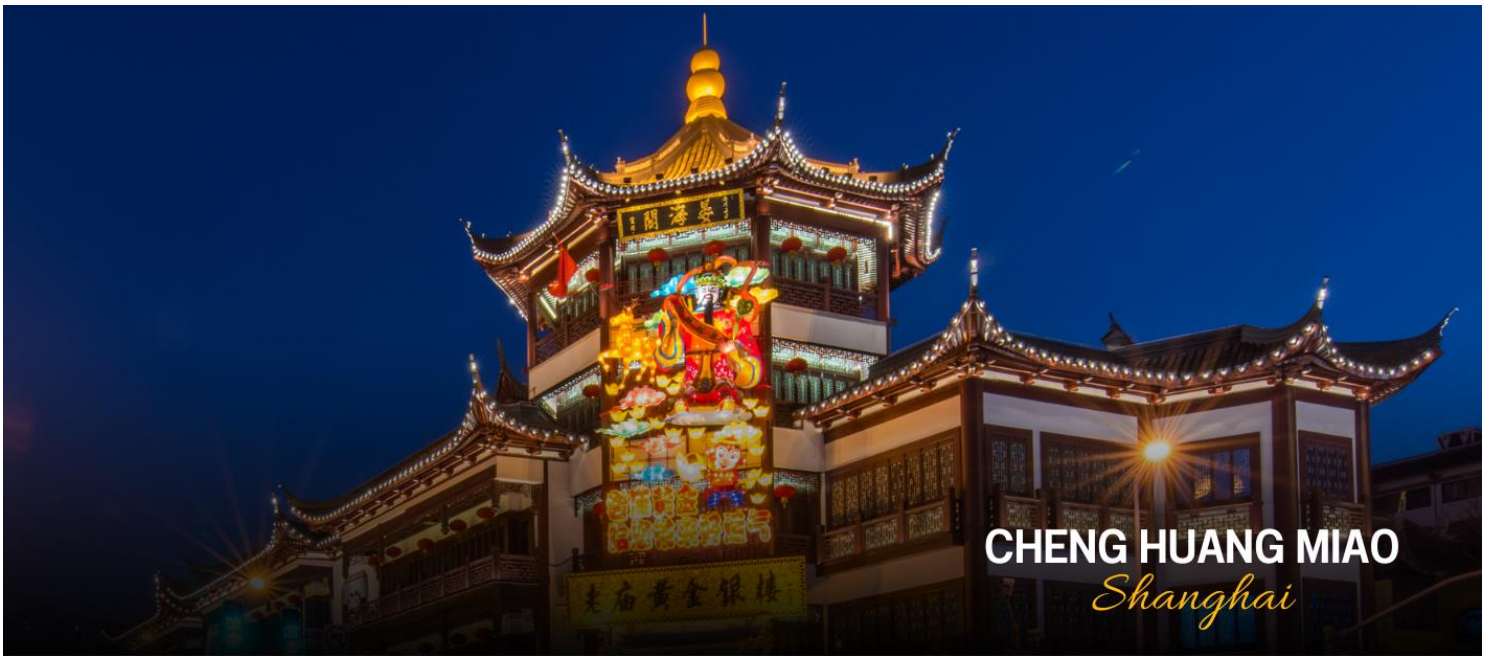
CHENG HUANG MIAO Shanghai