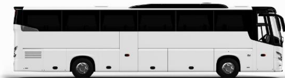
ตัวอย่างรูปการรถ 1 ชั้น

ค่าที่พักตามที่ระบุในรายการหรือเทียบเท่าระดับเดียวกัน (พักห้องละ 2 ท่าน) หากประเภทห้องที่ท่านริควมมาเดิม อาทิ เช่น ริควมห้องพักเป็น TWIN BED หรือ DOUBLE BED ทางบริษัทขอสงวนสิทธิ์ในการปรับประเภทห้องพัก เป็นตามที่โรงแรมมีอยู่ โดยไม่ต้องแจ้งให้ทราบล่วงหน้า