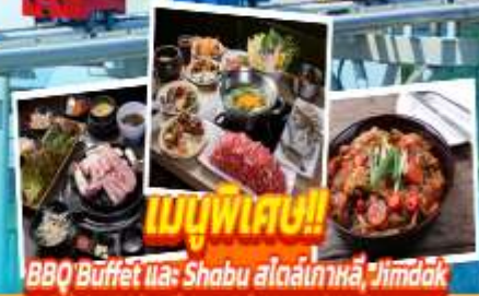
BBQ Buffet และ Shabu สเต็กเกาหลี, Jjimdok

เดินทาง เมษายน - มิถุนายน สายการบิน Air Busan (BX) น้ำหนักกระเป๋า 20 KG