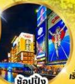
ช้อปปิ้ง ชิบูย่า