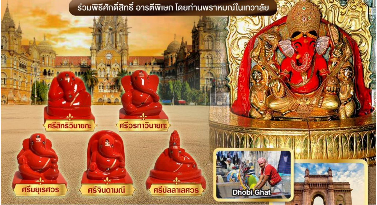
ศรีสิทธิวินายกะ

ร่วมพิธีศักดิ์สิทธิ์ อารตีพิฆเนศ โดยท่านพราหมณ์ในเทวาลัย