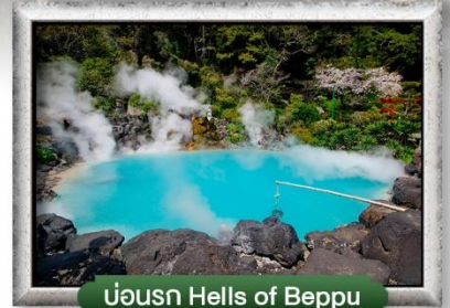
บ่อน้ำ Hells of Beppu