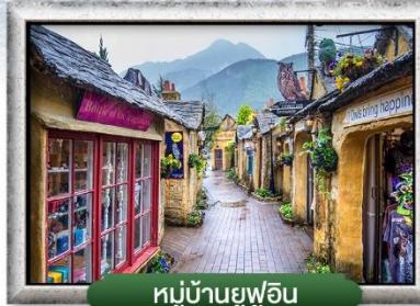
หมู่บ้านยูฟูอิน