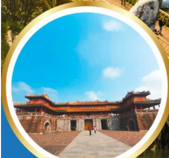
นครต้องห้าม