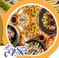
ลิ้มรส อาหารเวียดนามชาติ