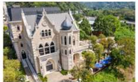
ปราสาทช็อคโกแลต