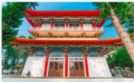
วัดพระถังซำจั๋ง