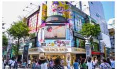
ช้อปปิ้งซีเหมินติง