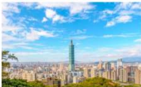
ช้อปปิ้งตึกไทเป101