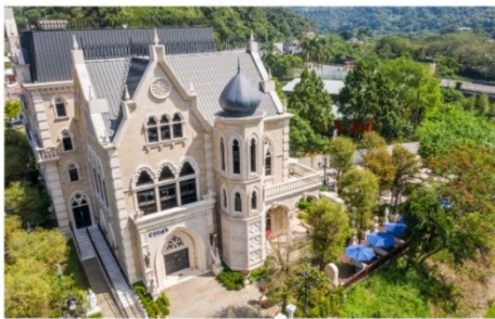
ปราสาทช็อกโกแลต