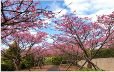
ชมซากุระอุทยานหยางหมิงซาน