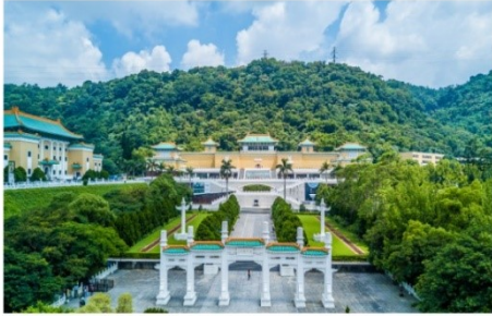
เข้าชมพระราชวังต้องห้ามกุ๊กกง