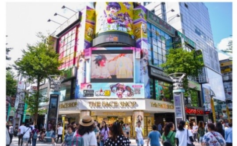
ช้อปปิ้งซีเหมินติง