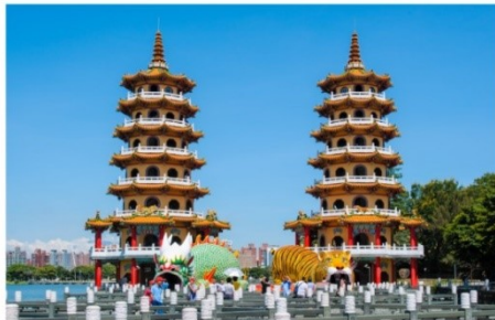
เจดีย์เสือเจดีย์มังกร