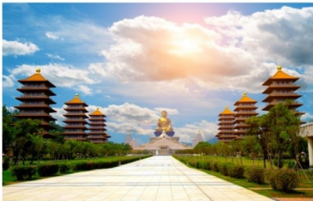
วัดไฟทองซาน