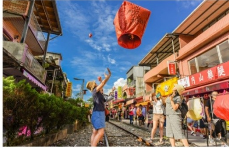
ปล่อยโคมลอยบนรางรถไฟ