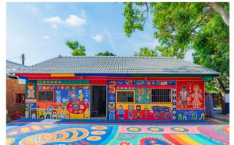
หมู่บ้านสายรุ้ง