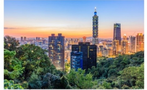
ช้อปปิ้งตึกไทเป101