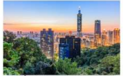
ช้อปปิ้งตึกไทเป101