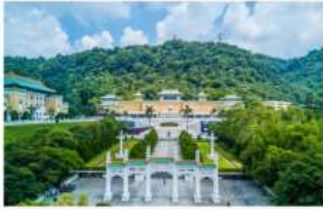
เข้าชมพระราชวังต้องห้ามกุ๊กกง