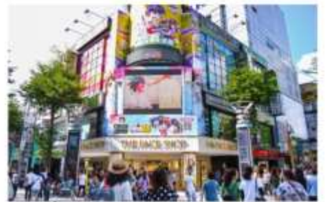
ช้อปปิ้งซีเหมินติง