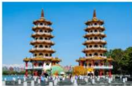
เจดีย์เสือเจดีย์มังกร