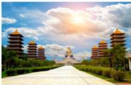
วัดไฟทองชาน