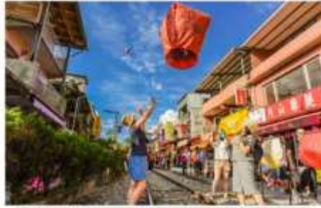
ปล่อยโคมลอยบนรางรถไฟ