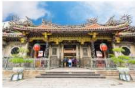
วัดหลงชาน