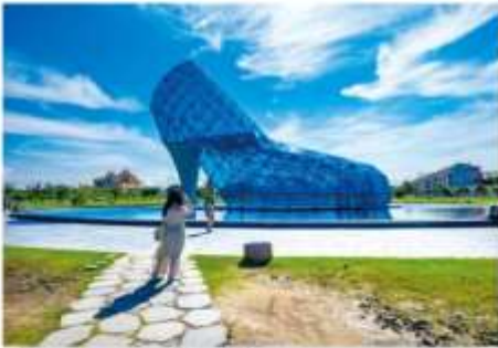
โบสถ์รองเท้าแก้ว