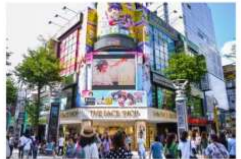
ย่านซีเหมินติง