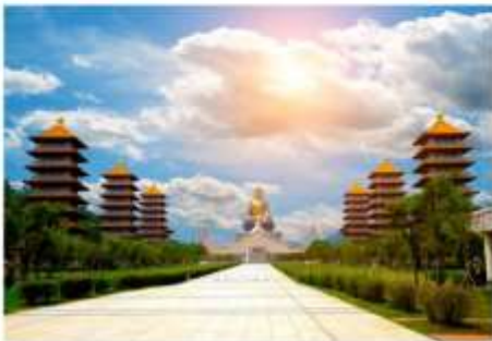
วัดไฟทองซาน