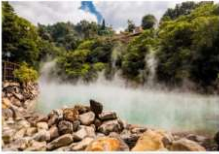
น้ำพุร้อนเป่ย์โถว