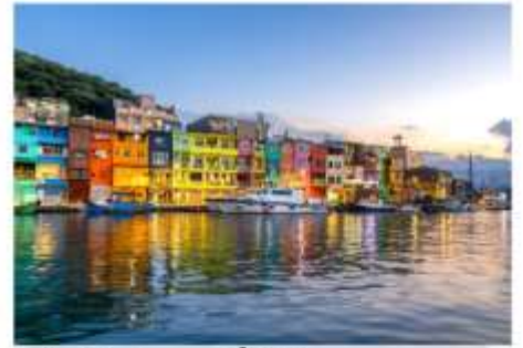
ท่าเรือประมงเจิ้งปิ่น