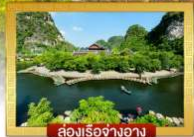
ส่องเรือจางอาง