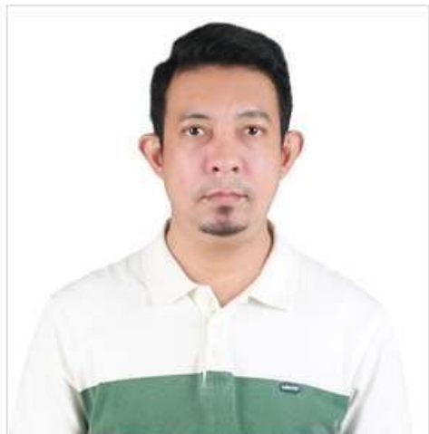
( ตัวอย่างรูปถ่าย )