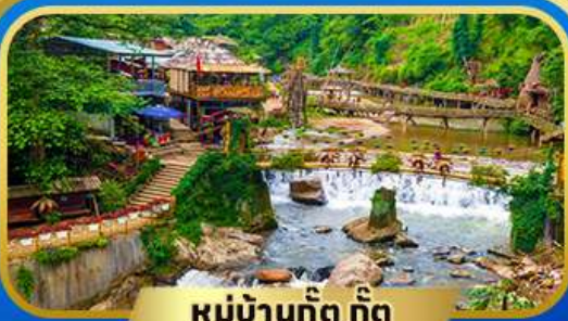
หมู่บ้านก๊อต ก๊อต

👤 พักขาป่า 2 คืน | 🍷 พิเศษ! บุฟเฟ่ต์ 1 มื้อ