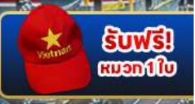
รับฟรี! หมวก 1 ใบ