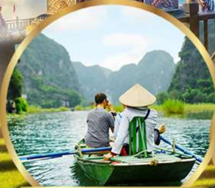
ล่องเรือกระจัดชมถ้ำตามทิว