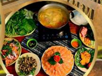
พิเศษ! ซาบูปลาแซลมอน หม้อไฟปลาสดอร่อย + ไวน์ดालัด