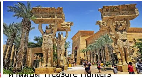
ient Egypt) นกัน จะได้พบ เล่นชนิดนี้มีชื่อ รถไฟเหาะที่จะ บรถึบตามลำ