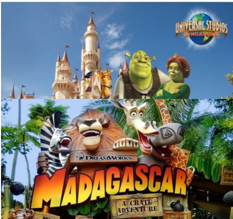
โซนที่6 ดินแดนแห่งเทพนิยาย (Far Far Away) โซนนี้จะได้พบกับตัว การ์ตูนแอนิเมชันจากเรื่องเชร็คและการฉายหนังการ์ตูน 4 มิติ และไฮไลท์ของ โซนนี้พาไปผจญภัยด้านแรงโน้มถ่วงกลางอากาศบนยอดต้นกล้วยักษ์เพื่อตาม หาห่านที่ออกไข่เป็นทองคำอันล้ำและยังมีเครื่องเล่นอีกมากมาย