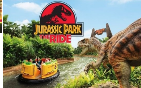
Lost World) รพญภัยในยุค r World เครื่อง