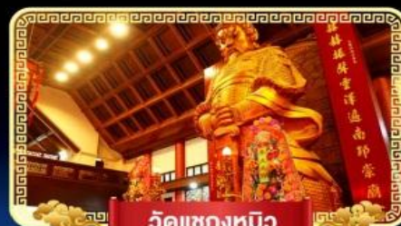
วัดเซกตงหมิว