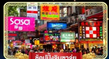
ช้อปปิ้งจิมซาจู้