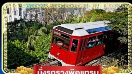
นั่งรถรางพิกแตรม

นั่งกระเช้ามองปิง 360 องศา บินลัดฟ้าไปมู..สู่เกาะฮ่องกง