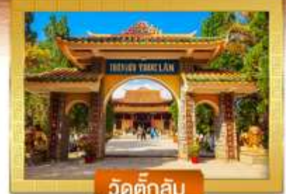
วัดตักสิม