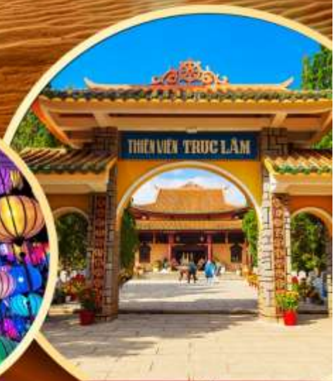
วัดตักลิ้ม