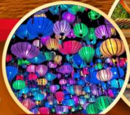
สวนแห่งแสง (Lumiere Light Garden)