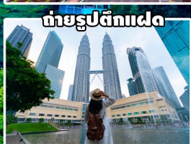
ถ่ายรูปตึกแฝด