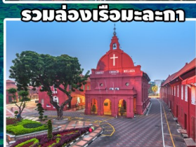
รวมล่องเรือมะละกา