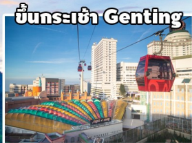
ขึ้นกระเช้า Genting