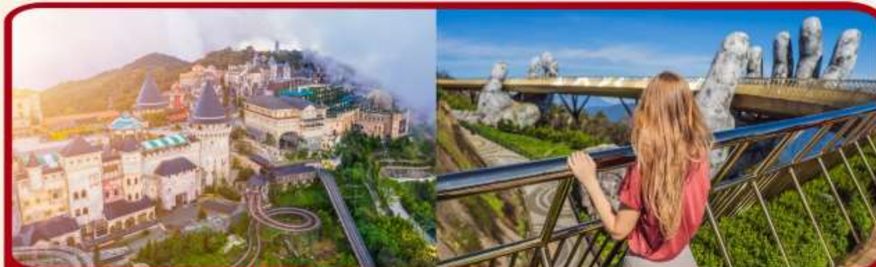
เที่ยวบานาฮิลล์เต็มวัน แบบจุใจ