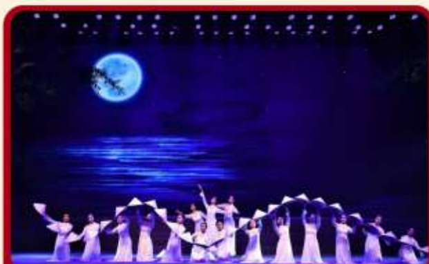
ชม CHARMING SHOW