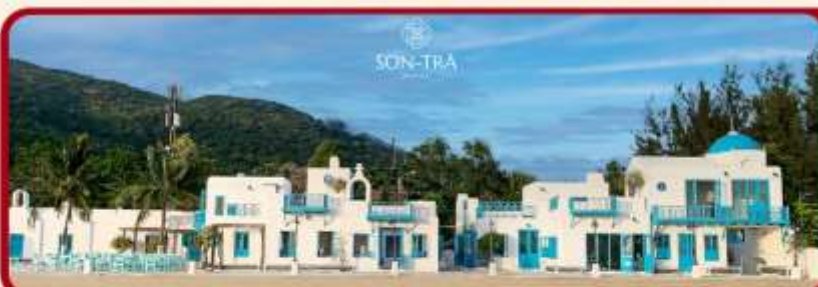
เช็คอินคาเฟ่ SON TRA MARINA