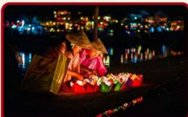
ล่องเรือลอยกระทงที่ฮอยอัน