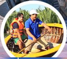
นั่งเรือกระต๊อ