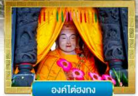
องค์ไต๋องกง