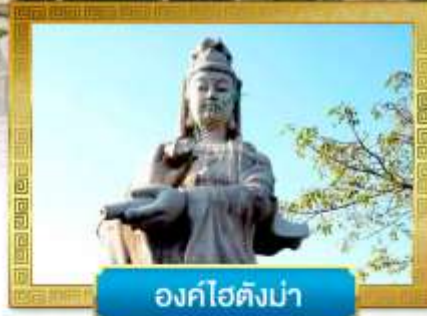
องค์โฮตังมา