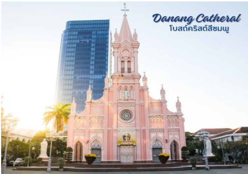
Danang Cathedral โบสถ์คริสต์ดานัง

นำท่านถ่ายรูป โบสถ์คริสต์ดานัง หรือโบสถ์คริสต์สีชมพู (Danang Cathedral) สร้างขึ้นสมัยเวียดนามตกเป็นอาณานิคมของฝรั่งเศส สถาปัตยกรรมสไตล์โกธิก ยตกแต่งด้วยความประณีตสวยงาม ตัวโบสถ์เป็นสีชมพูทั้งหลัง ตัดขอบด้วยสีขาว เป็นอีกหนึ่งสถานที่ที่ไม่ควรต้องพลาดเมื่อมาเยือนเมืองดานัง จากนั้น อิสระช้อปปิ้ง ตลาดฮาน อิสระเลือกซื้อสินค้าหลากหลายชนิด เช่นผ้า เกล้า บุหรี่ และของกินต่างๆ เป็นตลาดสดและขายสินค้าพื้นเมืองของเมืองดานัง