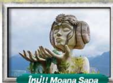
ใหม่!! Moana Sapa