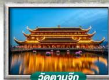
วัดตามจิก