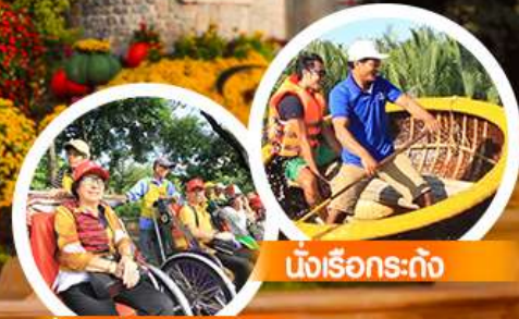
นั่งเรือกระต๊อ