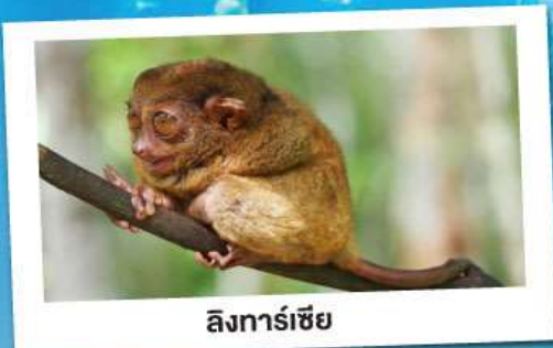
ลิ่งทาร์เซียร์

เดินทาง 21-24 ก.พ. 68 28 ก.พ.-03 มี.ค. 68 07-10, 14-17 มี.ค. 68 21-24, 28-31 มี.ค. 68 04-07 เม.ย. 68 (วันจักรี) 11-14 เม.ย. 68 (วันสงกรานต์) 18-21, 25-28 เม.ย. 68