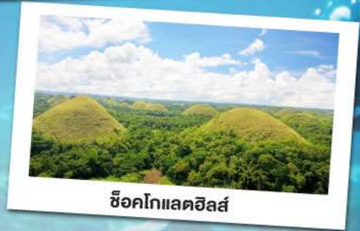
ช็อคโกแลตฮิลล์