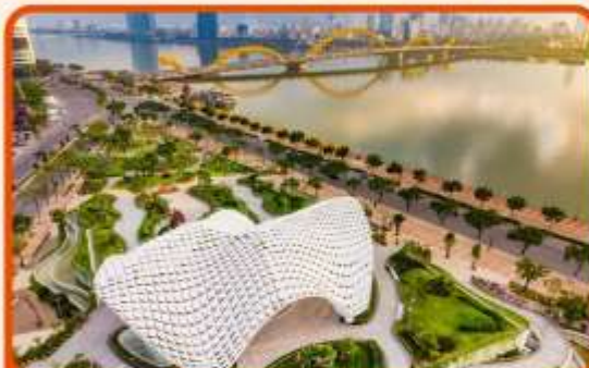
เช็คอิน แหล่งที่เที่ยวใหม่ APEC PARK