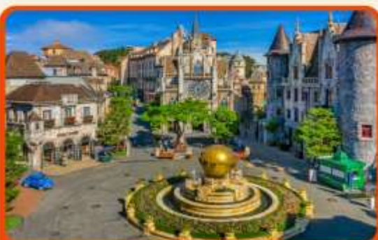
เที่ยวบานาฮิลล์แบบจุใจ เต็มวัน