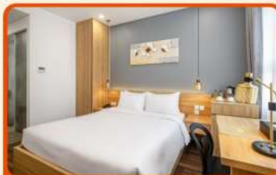
พักเมืองดานัง 4 ดาว 3 คืน