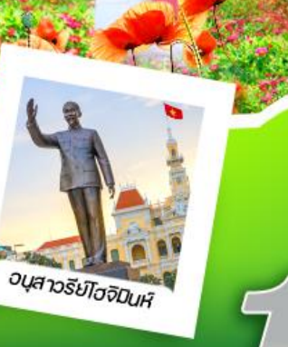
อนุสาวรีย์โฮจิมินห์