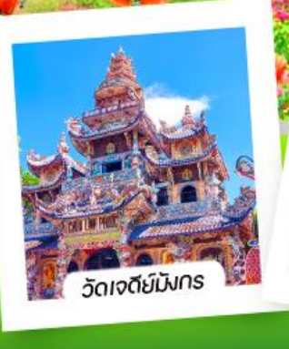
วัดเจดีย์มังกร