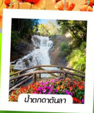
น้ำตกดาตันลา