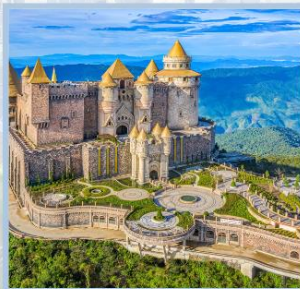
ปราสาทจันตรา