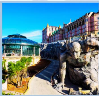
โซลู Eclipse Square