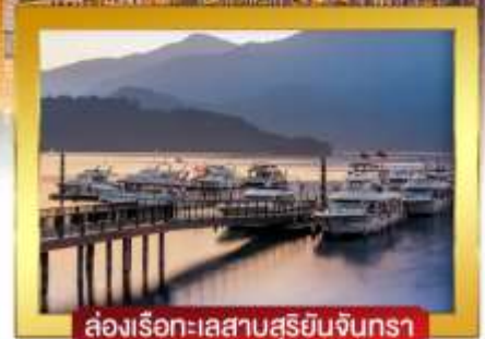
ส่องเรือทะเลสาบสุริยันจันทรา