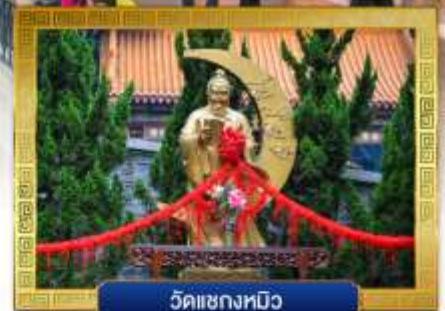
วัดเซกหมิว