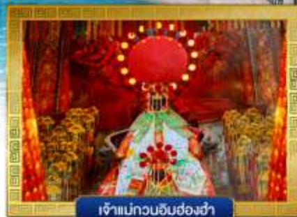
เจ้าแม่กวนอิมฮ่องฮ่า