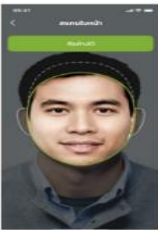
*สแกนใบหน้า เพื่อทำการเช็คอิน ผ่านแอปฯ อุจเงิน

10.25 น. เดินทางถึง สนามบินหาดใหญ่ ให้ท่านรับสัมภาระให้เรียบร้อย ไกด์นำเที่ยวรอท่านอยู่ด้านนอกที่จุดนัดพบ จากนั้นนำท่านออกเดินทางสู่จังหวัดยะลา โดยรถตู้ปรับอากาศ (ระยะทาง 140 ก.ม. ใช้เวลาเดินทาง 2 ชั่วโมง โดยประมาณ)