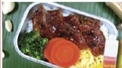
Chicken teriyaki with rice and water