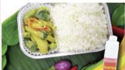
Green curry chicken with rice and water