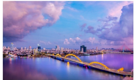
ชมสะพานมังกร