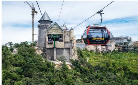
ขึ้นกระเช้าลอยฟ้า