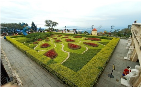
สวนดอกไม้แห่งความรัก