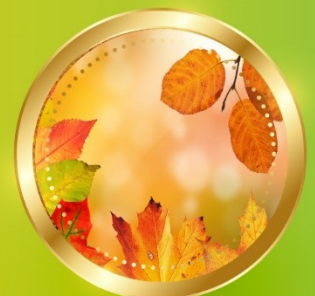
AUTUMN กันยายน-พฤศจิกายน