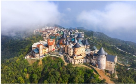
หมู่บ้านฝรั่งเศส