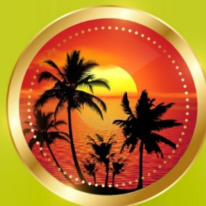
SUMMER มิถุนายน-สิงหาคม