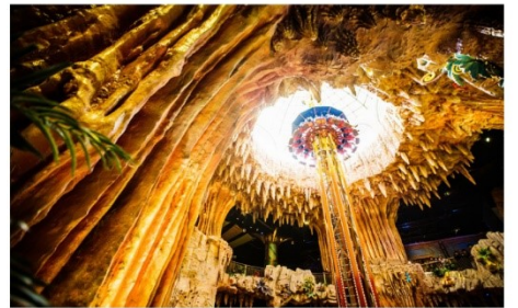
สวนสนุกแฟนตาซีพาร์ค