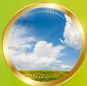
SPRING มีนาคม-พฤษภาคม