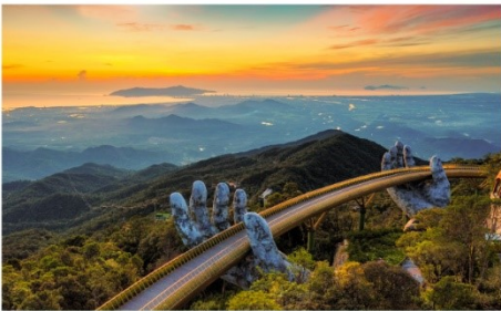
สะพานลอยฟ้า Golden Bridge