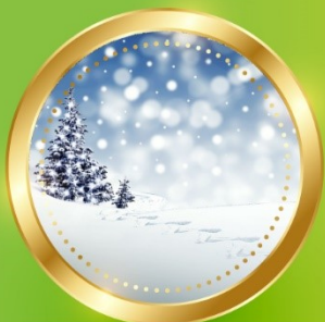
WINTER ธันวาคม-กุมภาพันธ์