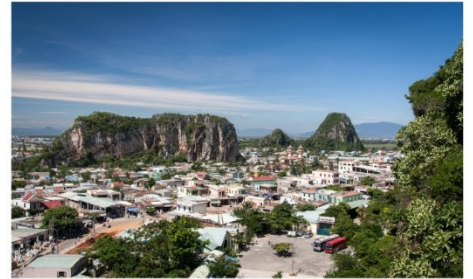
หมู่บ้านเกาะสลักหินอ่อน