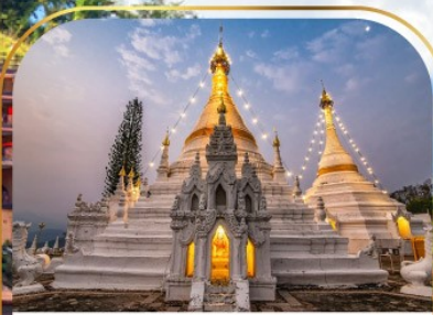
พระธาตุดอยกองมู

พาย | แม่ฮ่องสอน | วัดพระธาตุมะเข็ญ | ดมบนคนเดินพาย จุดชมวิวกะเลหมอกหุบไฮล | หมู่บ้านจีนยูนานสีตล | วัดน้ำ บ้านรักไทย | ปางอุ๋ง | สะพานซุตองเป่ | วัดจองคำ จองกลาง พระธาตุดอยกองมู | หมู่บ้านกะเหรี่ยงคอยาว | จุดชมอภิวสัน | ห้วยน้ำดัง