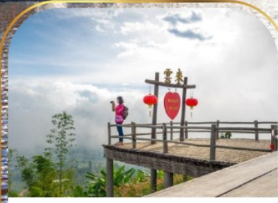
จุดชมวิวกะเลหมอกหุบไฮล