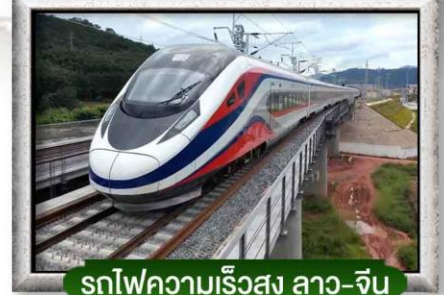
รถไฟความเร็วสูง ลาว-จีน