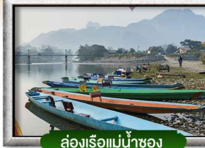
ล่องเรือแม่น้ำซอง