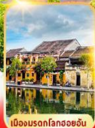
เมืองมรดกโลกฮอยอัน

ดานัง ฮอยอัน บานาฮิลล์ เที่ยวบานาฮิลล์เต็มวัน รวมบัตรเครื่องเล่น