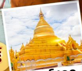
วัดกุโสโด