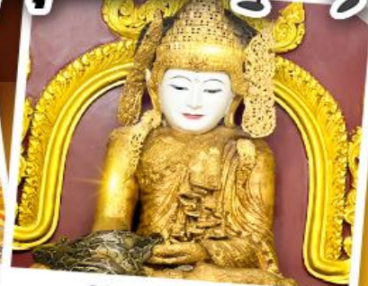
วัดมยุพะยา