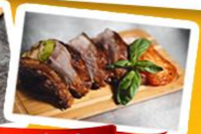
กึ่งแม่น้ำ + เบ็ดย่าง