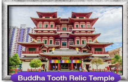
Buddha Tooth Relic Temple