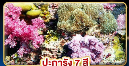
ปะการัง 7 สี