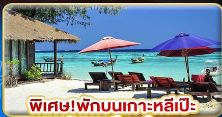
พิเศษ! พักบนเกาะหลีเป๊ะ อันดามัน รีสอร์ท

เกาะหลีเป๊ะ ทะเลสุดปัง พีเรียดสวย เทียวฟิน