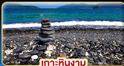
เกาะหินงาม