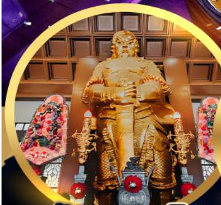
วัดเขกหมิว