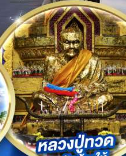
หลวงพ่อทวด ณ วัดช้างใต้