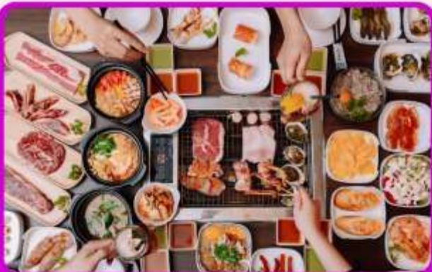
พิเศษ!! เมบูซาซิมิ+บุฟเฟ่ต์ปังย่าง