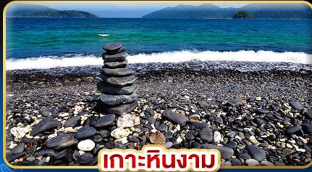
เกาะหินงาม