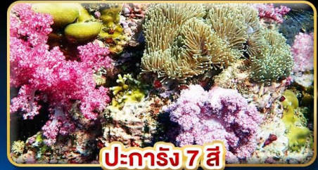
ปะการัง 7 สี