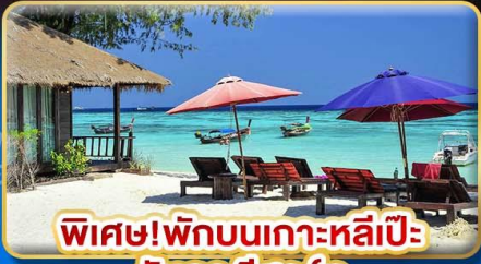
พิเศษ!พักรับบนเกาะหลีเป๊ะ อันดามัน รีสอร์ท

เกาะหลีเป๊ะ ทะเลสุดปัง พีเรียดสวย เทียบฟิน