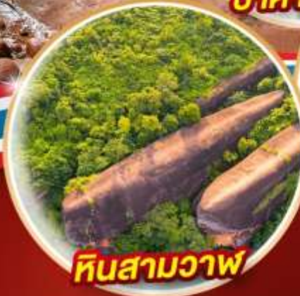
หินสามวาฬ