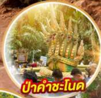
ป่าคำชะโนด

ตำนาน มนต์ขลัง แห่งพญานาค - ถ้ำนาคา @บึงกาฬ -