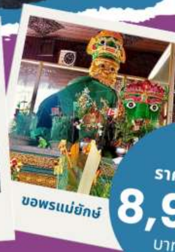
ขอพรแม่ยักษ์