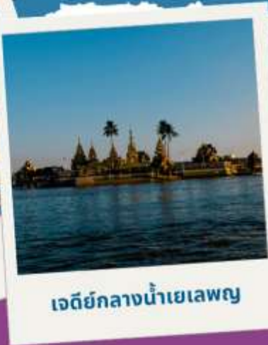
เจดีย์กลางน้ำเยเลพญา