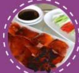
เปิดปีกกิ้ง