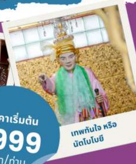
เทพทันใจ หรือ มัดโงโฮย