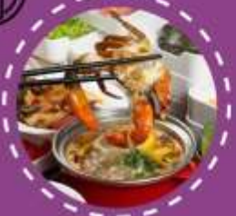
ชาบู ปุฟเฟ็ด