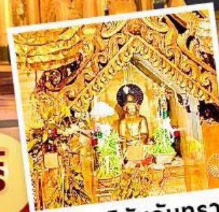
พระสุริยันจันทร