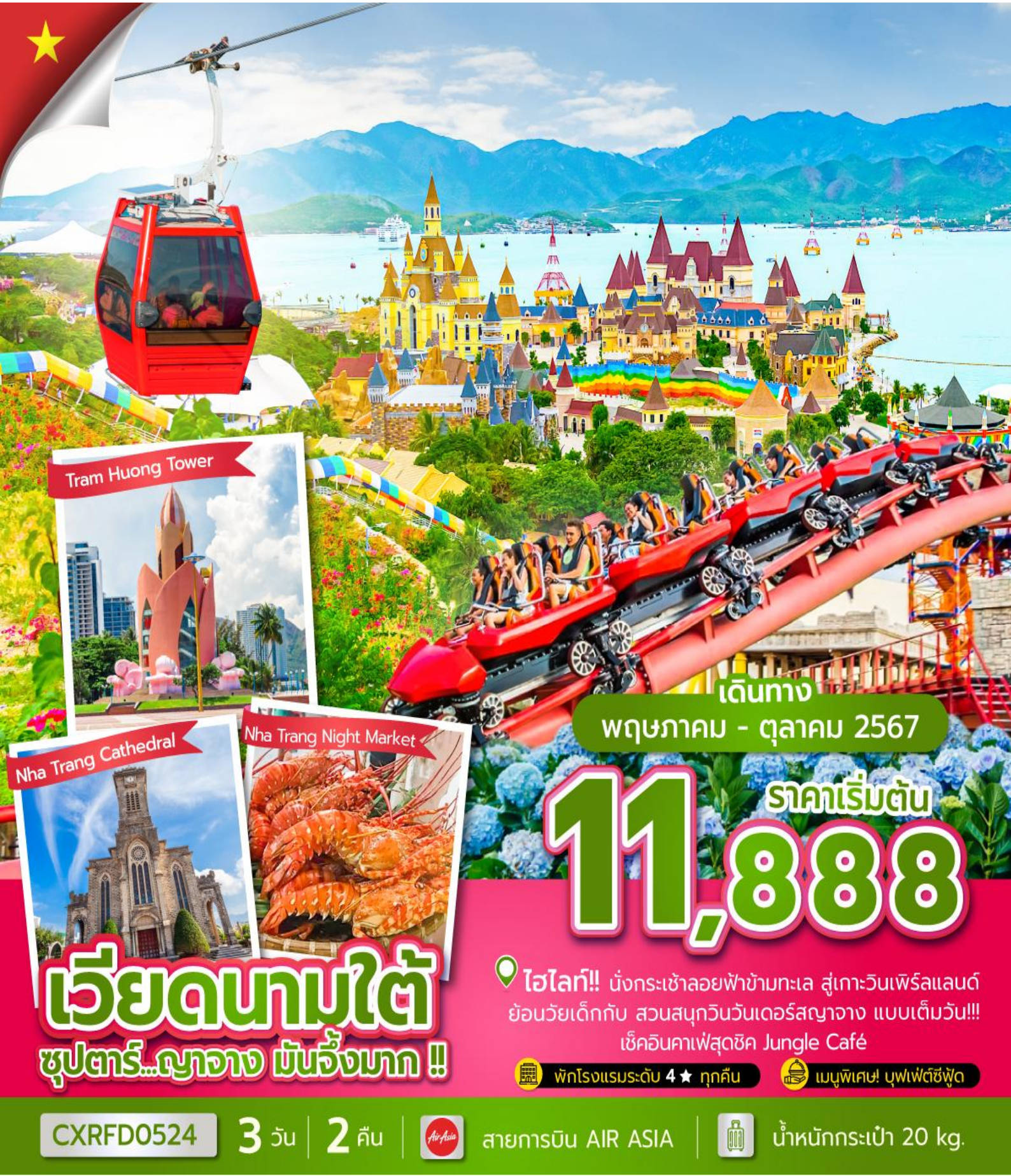
Tram Huong Tower

HOTLINE : 081 466 1335 / 081 361 9581 / 081 604 4858 www.colorfulholidaytour.com