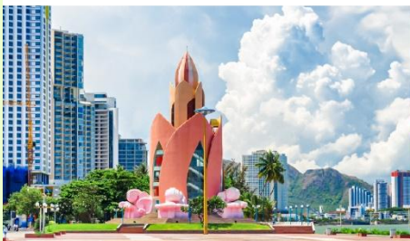
Tram Huong Tower