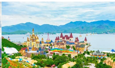
VinWonders NHA TRANG