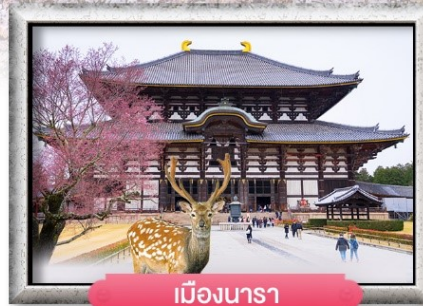
เมืองนารา