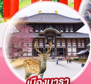
เมืองนารา