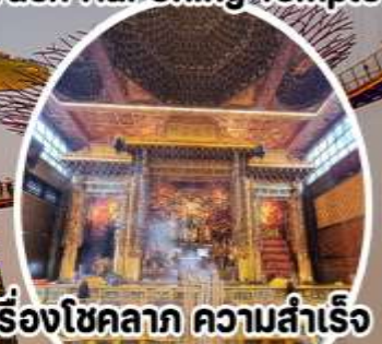
บุญ เรื่องโชคลาภ ความสำเร็จ Loyang Tua Pek Kong Temple