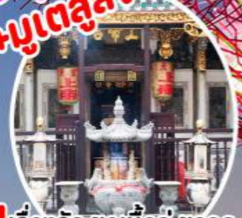
บุญ เรื่องรัก ขอนี้คือ ขอลูก Yueh Hai Ching Temple