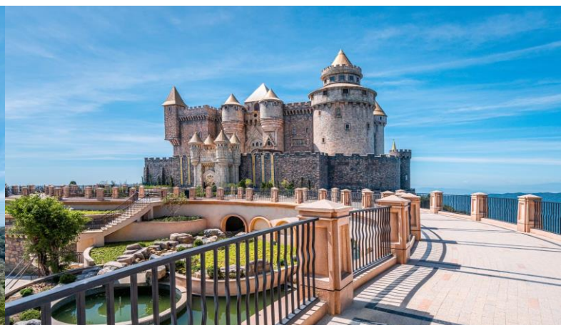
เครื่องเล่นในสวนสนุกหรือชมพระองศ์ใหญ่อยู่บนยอดเขาบาน่าฮิลล์

เที่ยง รับประทานอาหารเที่ยง ณ ภัตตาคาร บุฟเฟ่ต์อาหารนานาชาติบนบาน่าฮิลล์ (7)